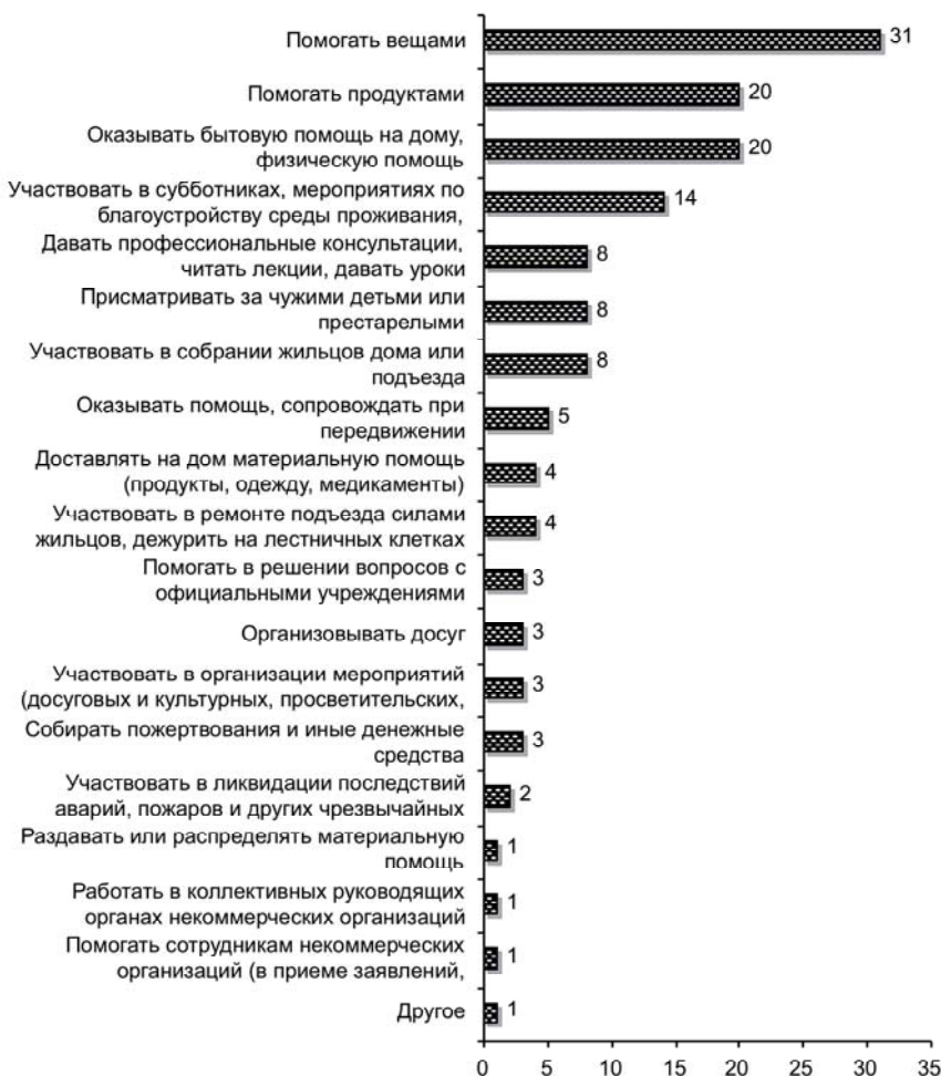
Рис. 2. Распределение ответов респондентов на вопрос: «Что из перечисленного Вам приходилось безвозмездно делать за последний год для других людей (не членов семьи и не близких родственников)?» (% числа опрошенных, допускался выбор любого числа вариантов ответа)

В нашей стране эмпирически опробованы разные способы изучения добровольческой активности населения социологическими методами 16 . Выше было показано распределение ответов на альтернативный вопрос: «За последние 2–3 года Вы занимались, помимо